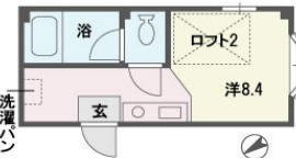
室内空間をナチュラルに改造しました。 壁面のライトグリーンが効果絶大。